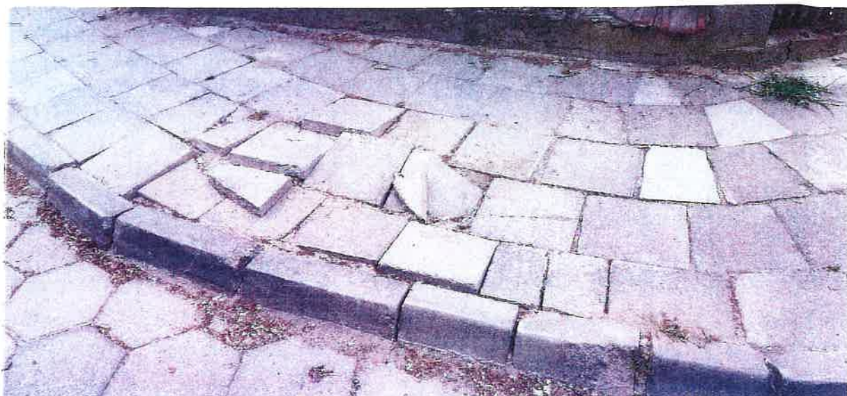
Chodnik na zakręcie Zielona - Pałucka