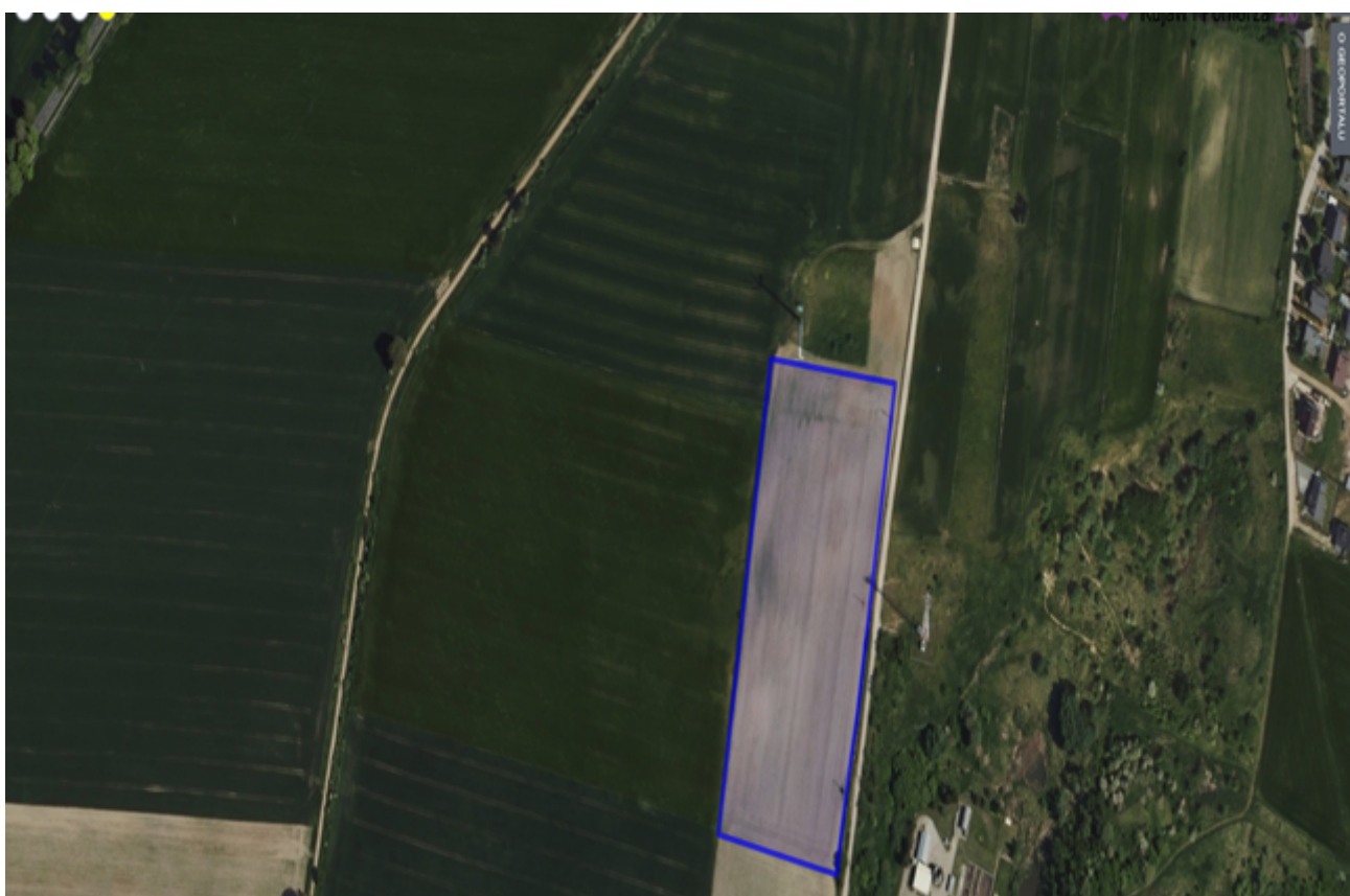
7. Działka numer 31/4 obręb Palmierowo.