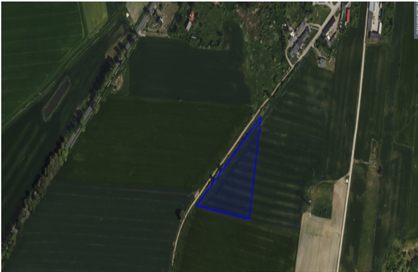
5. Działka numer 663/2 obręb Kcynia.