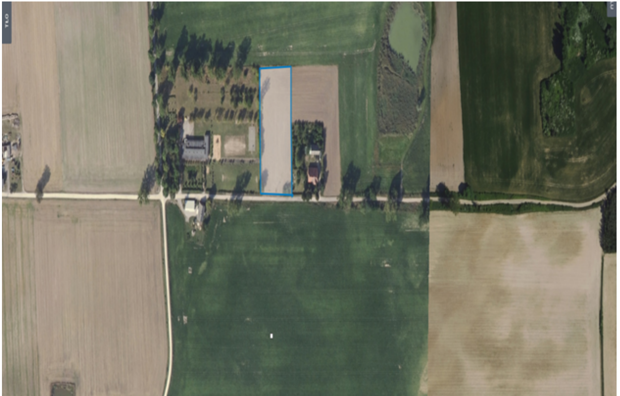
8. Działka numer 652/9 obręb Kcynia.