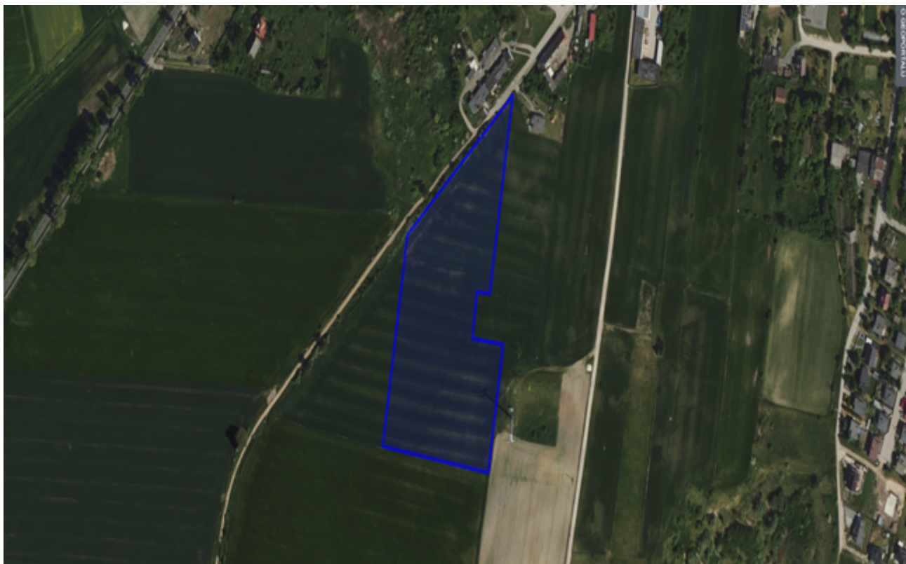
6. Działka numer 662/7 obręb Kcynia.