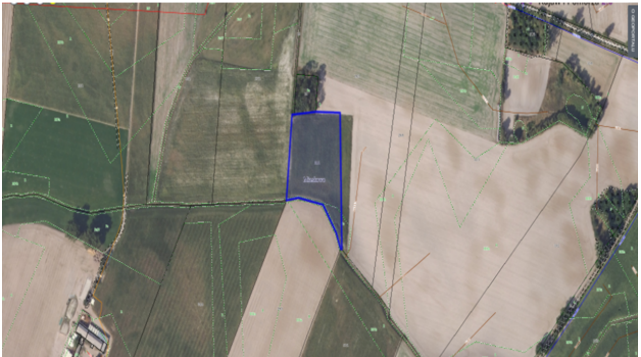
4. Działka numer 663/1 obręb Kcynia.