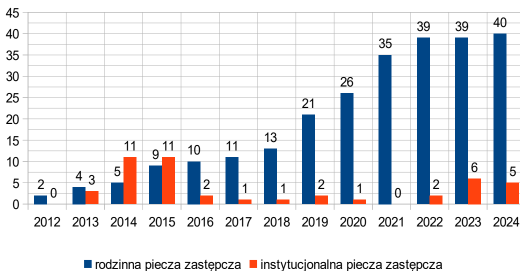
Wykres nr 2: Liczba dzieci umieszczonych w pieczy zastępczej w latach 2012-2024

Źródło: opracowanie własne na podstawie not obciążeniowych z Powiatowego Centrum Pomocy Rodzinie w Nakle nad Notecią