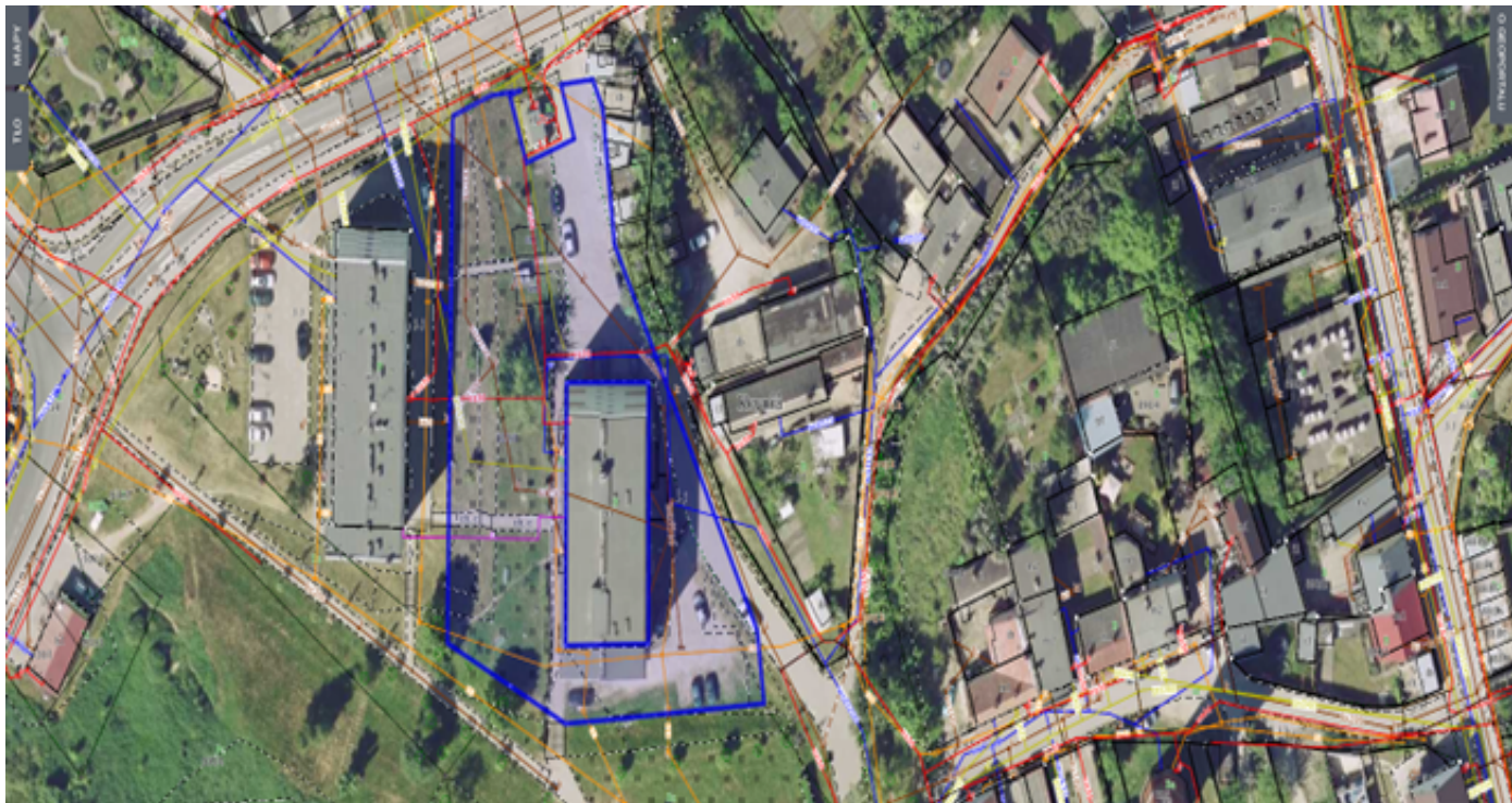
4. Działka numer 918/2 obręb Kcynia.